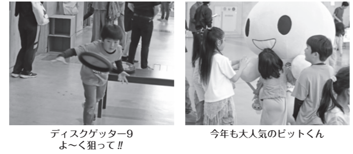
ディスクゲッター9 よ〜く狙って!! 今年も大人気のビッドくん