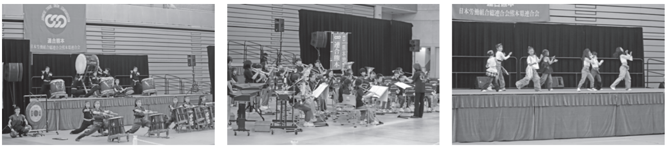
必由館高校和太鼓部 広安西小学校吹奏楽部 SIJ.ACADEMYによるダンスパフォーマンス

会場内には地協や構成組織、団体、福祉事業体の出展ブースの他に、子供向けのアトラクションやキッチンカーが4台有りました。献血カーでの献血は51人の方にご協力いただきました。メーデー参加者には100円の割引券が配布され、飲食ブースはたくさんの参加者でにぎわいました。