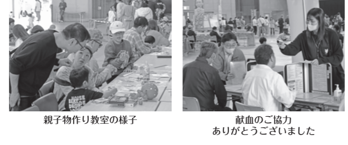
親子物作り教室の様子 献血のご協力ありがとうございました