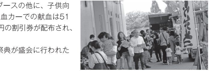
キッチンカーも大盛況

メーデー宣言 第97回メーデー熊本県中央祭典では、1920年の第1回以来、労働者の地位向上、人権・労働基本権の確立、民主主義と平和の発展を求めてきた歴史を改めて確認した。震災から年月が経つ今も、犠牲者への追悼と被災者への支援の思いを新たに、激甚化する災害への防災・減災の強化、そして支え合いの輪を広げる重要性を訴えた。国際社会で対立と分断が深まる中、対話による平和の実現と核兵器廃絶をめざし、世界の働く仲間との連帯を強める決意を示した。物価高で実質賃金が低迷し格差が拡大する現状を踏まえ、適正取引と持続的な賃上げの必要性を強調。過労死が続く状況から、長時間労働の是正と労働時間規制の強化を求め、働く者のための真の働き方改革を進める姿勢を示した。 私たちは、平和と人権が尊重され、多様性を認め合い、すべての働く仲間が笑顔で安心して働き、くらせる社会の実現に向け、集团的労使関係を強化・構築するとともに、働く者・生活者を優先する政策の実現を求める。今こそ、連帯の力によって、誰一人取り残されることのない社会を築いていこう！ 対話と連帯で築く、平和で笑顔あふれる未来 真の働き方改革で、安心してくらせる社会を！ 以上、ここに宣言する。