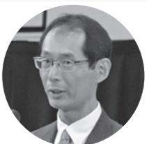
金谷 雅也 熊本労働局局長