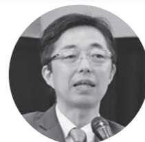
木村 敬 熊本県知事