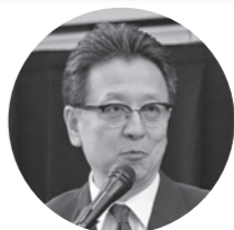
大西 一史 熊本市長