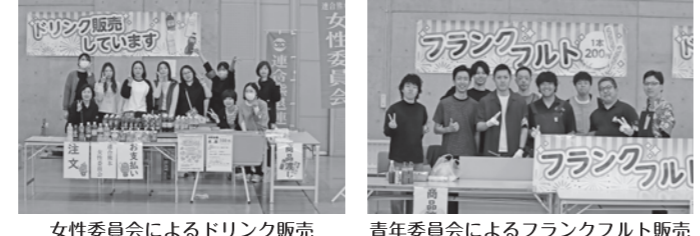
女性委員会によるドリンク販売 青年委員会によるフランクフルト販売