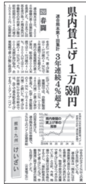
4月10日 熊日新聞記事

ています。また、「インフラ関係」でも、回答のあった全ての9組合でベースアップが実施され5%に近い賃上げ率となりました。