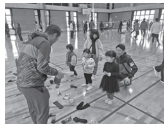
くつしたまいれ、はじめます！