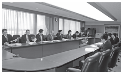
意見交換を行う出席者