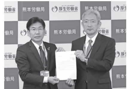
金成労働局長に要請書を手交